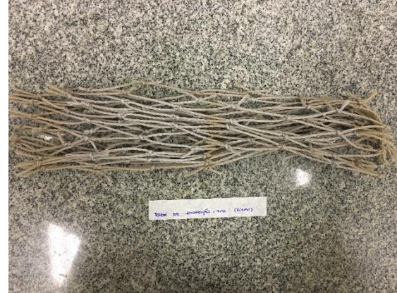
Foto 4. Amostra Transversal após intemperismo.