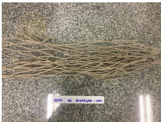
Foto 1. Amostra Longitudinal antes do intemperismo.